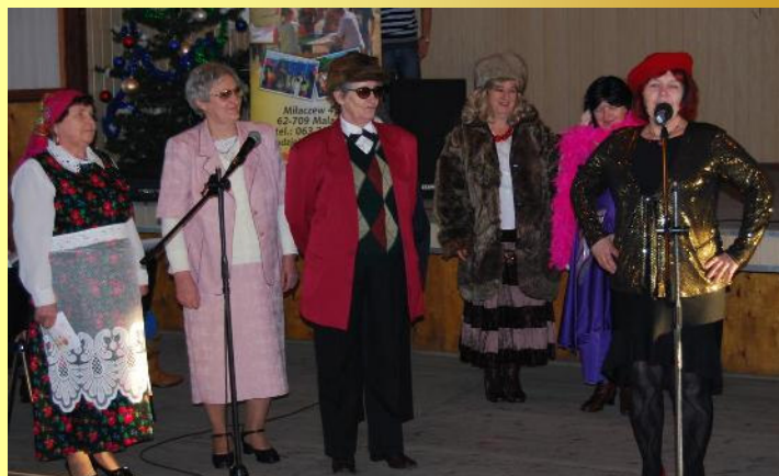
Zespół Jarzębinki w skeczu pt. „Unijna żona dla Stefana”

razem zaprezentował premierę „Unijna żona dla Stefana”. W organizację uroczystości włączyli się harcerze z XII DH ISKRY. Mamy nadzieję, że spotkanie na długo pozostanie w pamięci kochanych Babć i Dziadków.