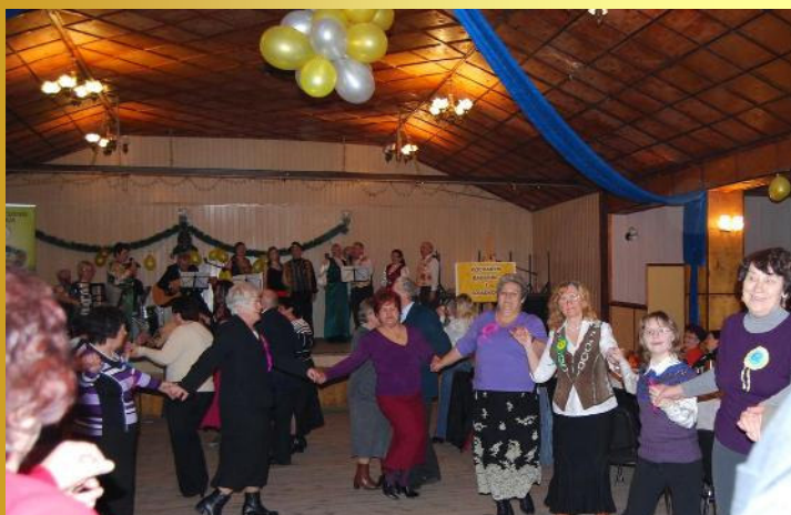
Babcie i dziadkowie chętnie tańczyli przy muzyce zespołu Niechcice