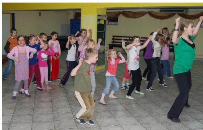
Dzieci z grupy młodszej chętnie tańczą hip-hop

Gminne Centrum Kultury i Sportu w Malanowie informuje, że istnieje jeszcze możliwość zapisów. Dodatkowe informacje o zajęciach tanecznych uzyskają Państwo w siedzibie Gminnego Centrum Kultury i Sportu w Malanowie, ul. Kaliska 2 lub pod numerem tel. (63) 2883322.