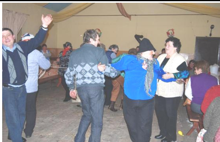
Po darciu pierza przyszedł czas na tańce

W ciągu tych trzech dni panowała wesoła atmosfera. Świadczył o tym fakt kultywowania starego zwyczaju ostatkowego jak „chodzenie z Misiem”. Każdego wieczoru inne osoby wcielały się w przebierańców. Organizatorzy przygotowali informację na temat historii darcia pierza, którą przypomnieli uczestnikom. A dla wszystkich którzy przybyli na pierzak przygotowany został poczęstunek. Stoły uginały się pod ciężarem swojskiego jadła m.in.: klusek „żelaznioków”, „prażoków”, kapusty z grochem, zupa grzybowej, żuru, śledzi w śmietanie, „gziki”, kompotów z suszu i innych smakołyków, w Tłusty Czwartek nie zabrakło pączków (także tych ufundowanych przez pana wójta), a wszystko zostało przygotowane przez mieszkańców wsi Bibianna. Według tradycji pierzak kończy się zabawą taneczną zwaną wyskubkiem, ponieważ gospodyni, która nie zorganizowała wyskubka nie miała co liczyć na pomoc w przyszłym roku. Inicjatorami pierzaka w Bibiannie byli podobnie jak