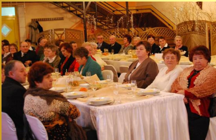
Na uroczystość chętnie przybyli członkowie stowarzyszenia