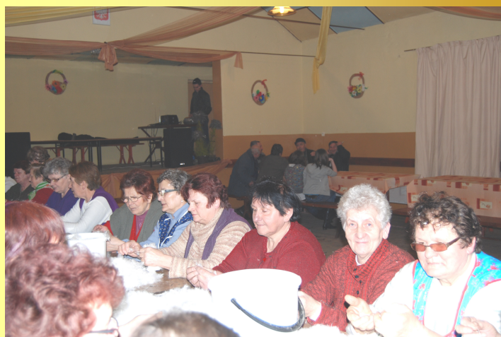
Darcie pierza umilały rozmowy i śpiewy

Mimo mrozu i śniegu zalegającego na naszych drogach, do remizy dotarło kilkadziesiąt osób. Kobiety były pochłonięte darcie pierza, a panowie znaleźli dla siebie zajęcia: grali w karty, przypomnieli sobie grę w warcaby i szachy. Młodzież grała w tenisa i piłkarzyki. Wiele osób zainteresowanych tym obyczajem obserwowało żmudną pracę kobiet, które umiały sobie czas wraz z zespołem