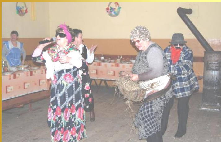
Na pierzaku pojawili się przebierańcy

W dniach 11-13 lutego w sali OSP w Bibiannie odbywało się darcie pierza. Tradycja ta już zanika, ale my chcemy ją utrzymać, ponieważ to jest bardzo ważny element integracji społecznej i kultury ludowej.