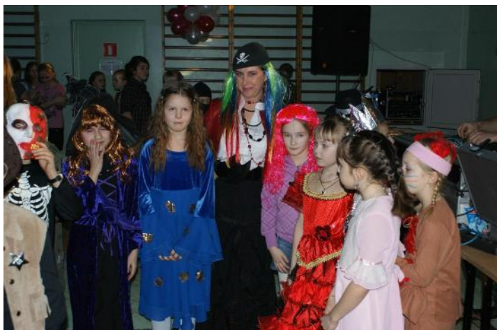
Dzieci w bajkowych strojach wraz z wychowawczynią

Przygotowania do balu rozpoczęły się od dekoracji sali gimnastycznej, którą przyozdobiło mnóstwo kolorowych balonów. Hasło tegorocznego balu brzmiało „JAK W BAJCE”. Pomysłowość uczniów jak zwykle przeszła wszelkie oczekiwania. Księżniczki tańczyły ze Smokami, Czarownice skakały z Rycerzami, Wilk „uwodził” Jasiowi Małgosię, a Królowy chętnie pozowały do zdjęć z Wampirami. Kolorowi przebierańcy w radosnych nastrojach tworzyli barwne korowody. Podczas przerw można było odpocząć i posilić się poczęstunkiem, który przygotowali rodzice. To był wesoły i roztańczony wieczór – jak w bajce.