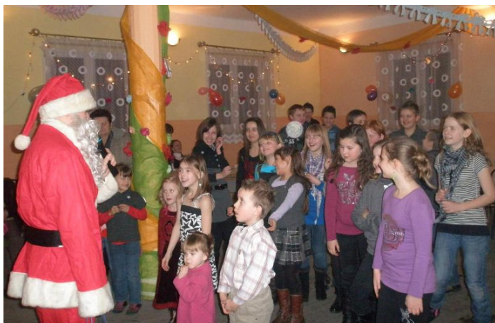
Wizyta Mikołaja sprawiła dzieciom wiele radości

D nia 30 stycznia już po raz czwarty i na pewno nie ostatni Stowarzyszenie Sportowo-Kulturalne Wsi Czachulec zorganizowało choinkę noworoczną dla dzieci.