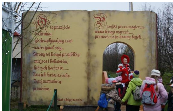
Przejście przez drzwi Magicznej Księgi

Najpierw zatrzymał dzieci przy Młynie do mielenia złych postępków. Na specjalnej kartce trzeba było wypisać