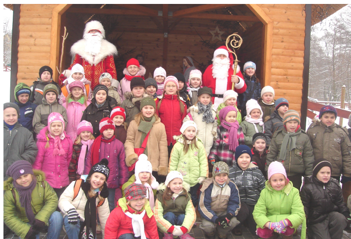
Spotkanie z Mikołajem w Baśniowej Krainie

Kolejne dwa wyjazdy w dniach 21 i 22 stycznia zorganizowane zostały do Miejskiego Domu Kultury w Turku. Uczniowie klas III – VI wzięli udział w spotkaniu z łódzkim ZOO. Pracownicy ogrodu zoologicznego przekazali dzieciom wiele cennych informacji o życiu i środowisku zwierząt oraz przedstawili swoich ulubieńców, wśród których największe wrażenie zrobił pyton królewski. Każdy miał możliwość dokładnie przyjrzeć się