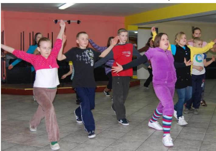
Układ taneczny w wykonaniu dzieci z grupy starszej

Głównym celem zajęć tanecznych jest zapoznanie z podstawowymi krokami różnych stylów tańca: walca angielskiego, walca wiedeńskiego, cha-cha, hip-hop, a także rytmem muzycznym. Zajęcia mają na celu również wspomaganie rozwoju fizycznego i ruchowego dzieci. W miarę zdobywania umiejętności przez uczestników zajęcia te zostaną poszerzone o kolejne, bardziej zaawansowane kroki taneczne oraz dodatkowe układy tańca.