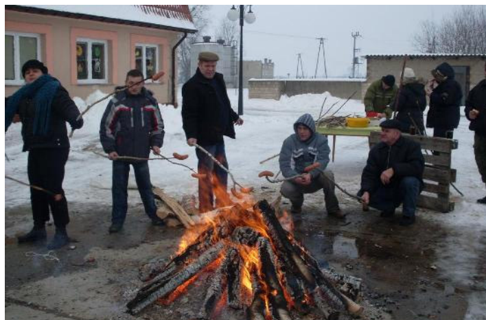
Pieczone kiełbaski smakowały wyśmienicie