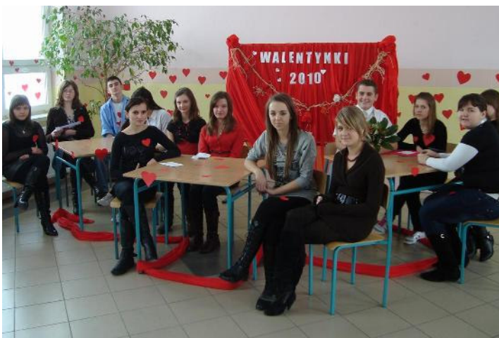
Gimnazjaliści w przedstawieniu pt. „Listy o miłości”