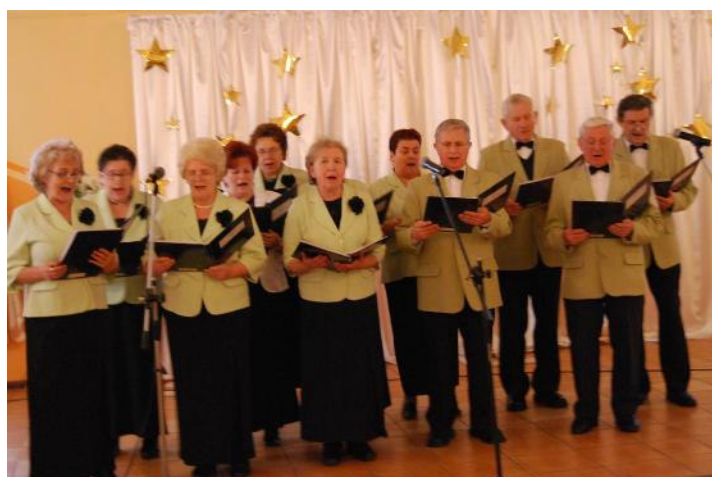
Wszystkim gościom czas umiłał zespół „Serenada” z Dobrej

Dnia 19.01.2010 r. Stowarzyszenie Emerytów w Malanowie po raz drugi zorganizowało Dzień Babci i Dziadka dla swych członków. Impreza ta tradycyjnie zgromadziła liczne grono uczestników.